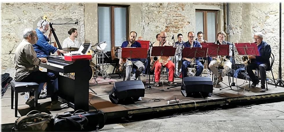
San Vincenzo Jazz Syndacate

Si è avvicinato alla musica intorno ai 14 anni, soprattutto al nuovo genere Trap, passando da ascoltare musica a farla. Porta i suoi testi e un nuovo modo di fare musica utilizzando parole in rima.