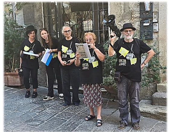
Una lettura del corteo poetico