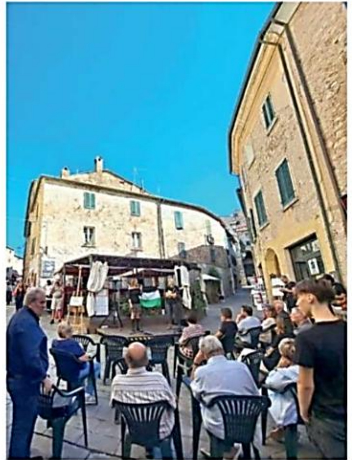
Un reading nel centro storico di Suvereto