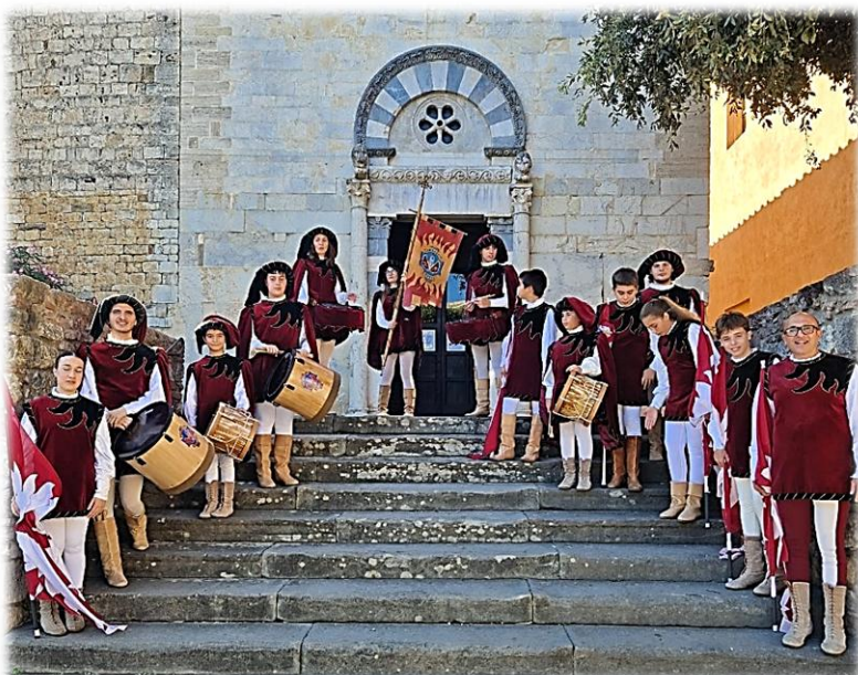
Compagnia Sbandieratori e Musicisti "Santa Croce"

Grazie a tutta la gente di Suvereto che l'ha reso possibile