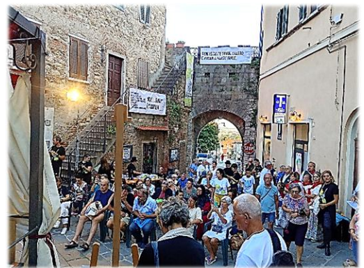
Piazza Don Biondi